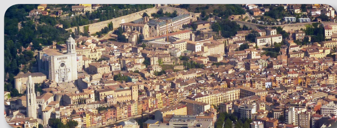
Gérone, un marché à 22 mn de la France

* Palmarès Twitter : Espagne, 9e pays, France, 16e pays du monde (Websa100, oct 2014).